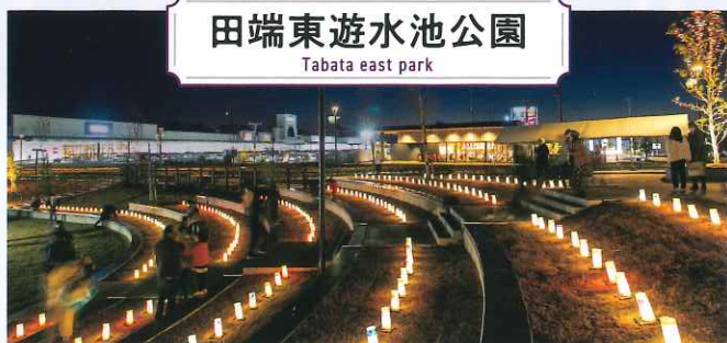
田端東遊水池公園

袋井市豊沢2777 Tel.0538-43-3601 【期間】2024年11月23日(土・祝)~ 12月1日(日) 【時間】17:00~20:45