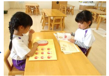
借りる前に どんなお話か チェック!!!