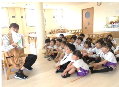
読み聞かせから スタートします

あゆみ園のランチルームには「あゆみ図書館」があります。 年長を対象に毎週金曜日は、絵本の貸し出し日です。 では、「あゆみ図書」の様子を紹介します。( ^o^ ) /